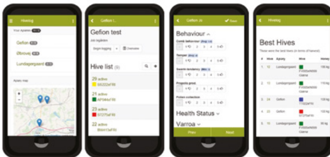
Fig. 2 : Plusieurs tableaux de bord disponibles sur Hivelog

Dans les paragraphes qui suivent, nous vous présentons quelques-unes des fonctionnalités de Hivelog, classées selon leur utilité et leur facilité d'utilisation.