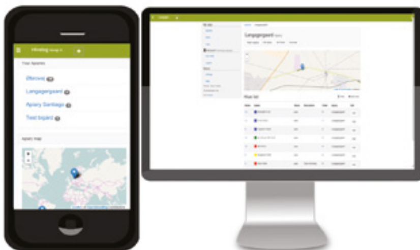
Fig. 3 : Exemple de tableau de bord en version mobile et écran d'ordinateur.

En outre, l'application mobile est conçue pour être très simple à utiliser sur le terrain et dans un rucher. Mais ce qui la distingue vraiment, c'est sa portabilité et son accessibilité. Il s'agit d'un site