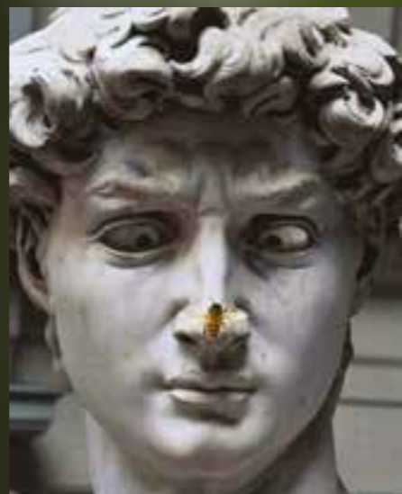
Auteur inconnu, d'après David de Michel-Ange.