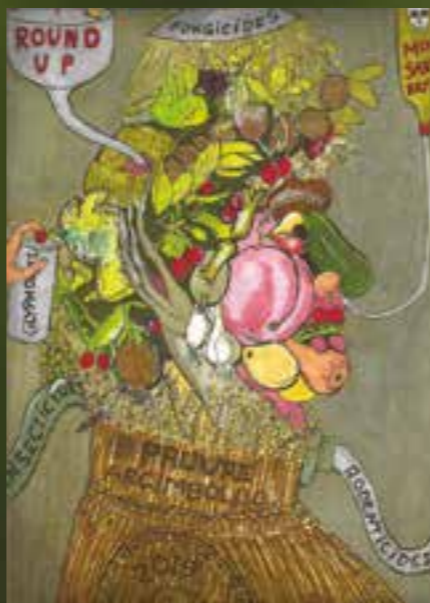
Gaspard D., d'après l'Été d'Arcimboldo