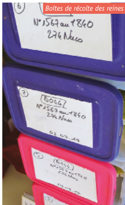
Boîtes de récolte des reines