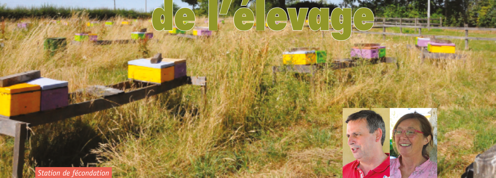
Station de fécondation