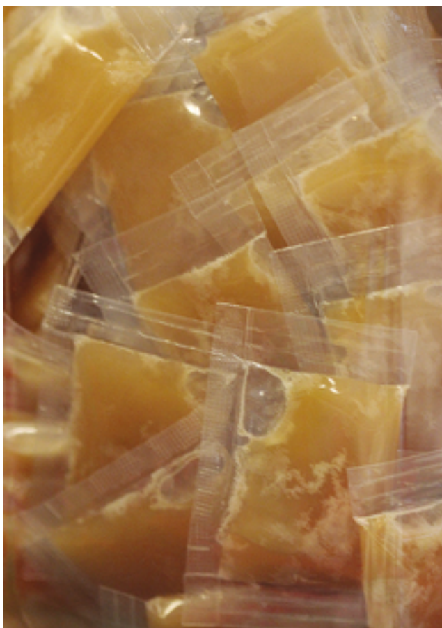
Berlingots de miel

Par son appui à la CIOEC (Coordinadora Interinstitucional de Organizaciones Económicas Campesinas, Indígenas y