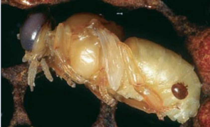
Adulte varroa se nourrissant de l'hémolymphe de la nymphe

Marla Spivak est bien connue depuis 1993 pour son travail de sélection d'abeilles hygiéniques (HYG) avec des tests de congélation de couvain à l'azote liquide (HYG est la dénomination pour hygiénique simple, c'est-à-dire des colonies qui enlèvent les nymphes malades ou mortes). Début des années 2000, Spivak reçoit des reines SMR de chez Harbo et décide de faire un test à l'azote pour vérifier le comportement d'hygiène de ces abeilles SMR - test illogique, pourrait-on dire, car un esprit cartésien n'en attendrait rien... À sa grande surprise, elle a trouvé que ces abeilles SMR nettoyaient la zone congelée avec 98 % d'efficacité. C'était vraiment bizarre car Harbo n'avait JAMAIS sélectionné sur ce caractère, il avait seulement sélectionné sur des abeilles qui réduisent le taux de reproduction des varroas (pensait-il), mais sans jamais expliquer réellement le phénomène SMR.