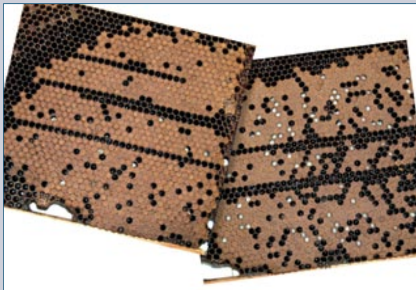
Pour démontrer la sensibilité hygiénique à Varroa par les abeilles SMR, un cadre de couvain très infesté a été découpé en 2 morceaux. Chaque moitié a été placée dans une cage avec 2.000 abeilles pendant 24 h. A gauche : les abeilles témoins ont enlevé seulement 12 nymphes et désoperculé 19 nymphes (33% des cellules non operculées étaient infestées par le varroa), alors que les abeilles SMR, à droite, ont enlevé 215 nymphes et désoperculé 178 autres nymphes (90% des cellules désoperculées étaient infestées par des varroas).

Jeffrey HARRIS (D214-1) (D214-2) - photo extraite de Agricultural Research , octobre 2005, p. 8-9